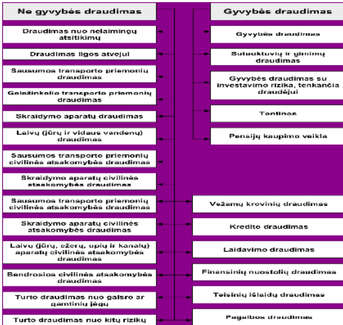
3 pav. Draudimo rūšys (sudaryta autorės pagal Draudimo įstatymą)

Ūkininkas norėdamas apdrausti savo ūkio veiklą, savo gyvybę ar sveikatą, turimą turtą ir kitus interesus turi kreiptis į draudimo įmonę (draudiką) ir sudaryti draudimo sutartį.