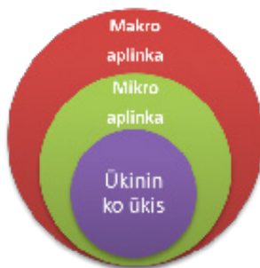
2 pav. Ūkininko ūkio verslo aplinka (parengta autorės)

Verslą veikia daug veiksnių. Pagal poveikio pobūdį jie skirstomi į mikroaplinkos ir makroaplinkos veiksmus (2 pav.).